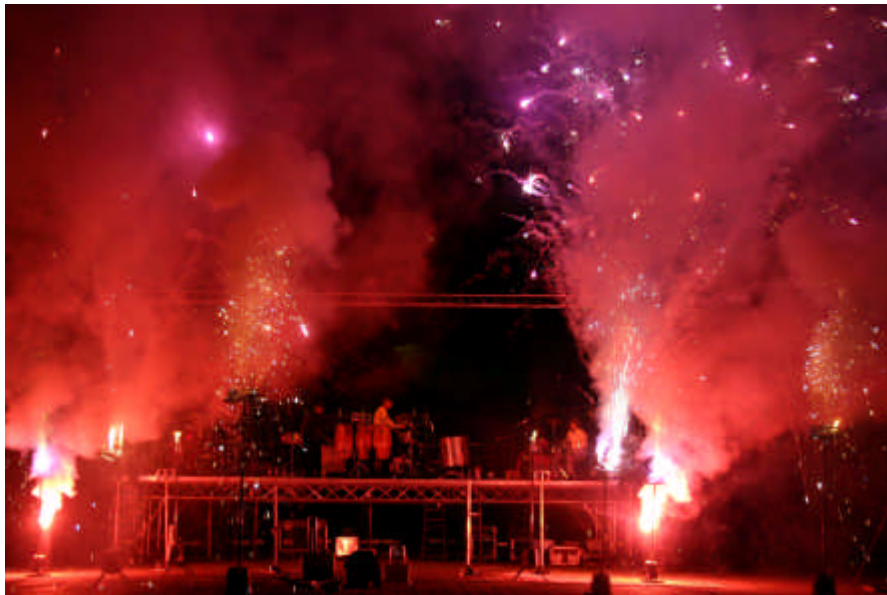
oben – „Seegflüster“, Hagen 2005, unten „Dortmunder Museumsnacht 05“, ca. 10.000 Zuschauer, 25m Abstand von Bühne zum Publikum