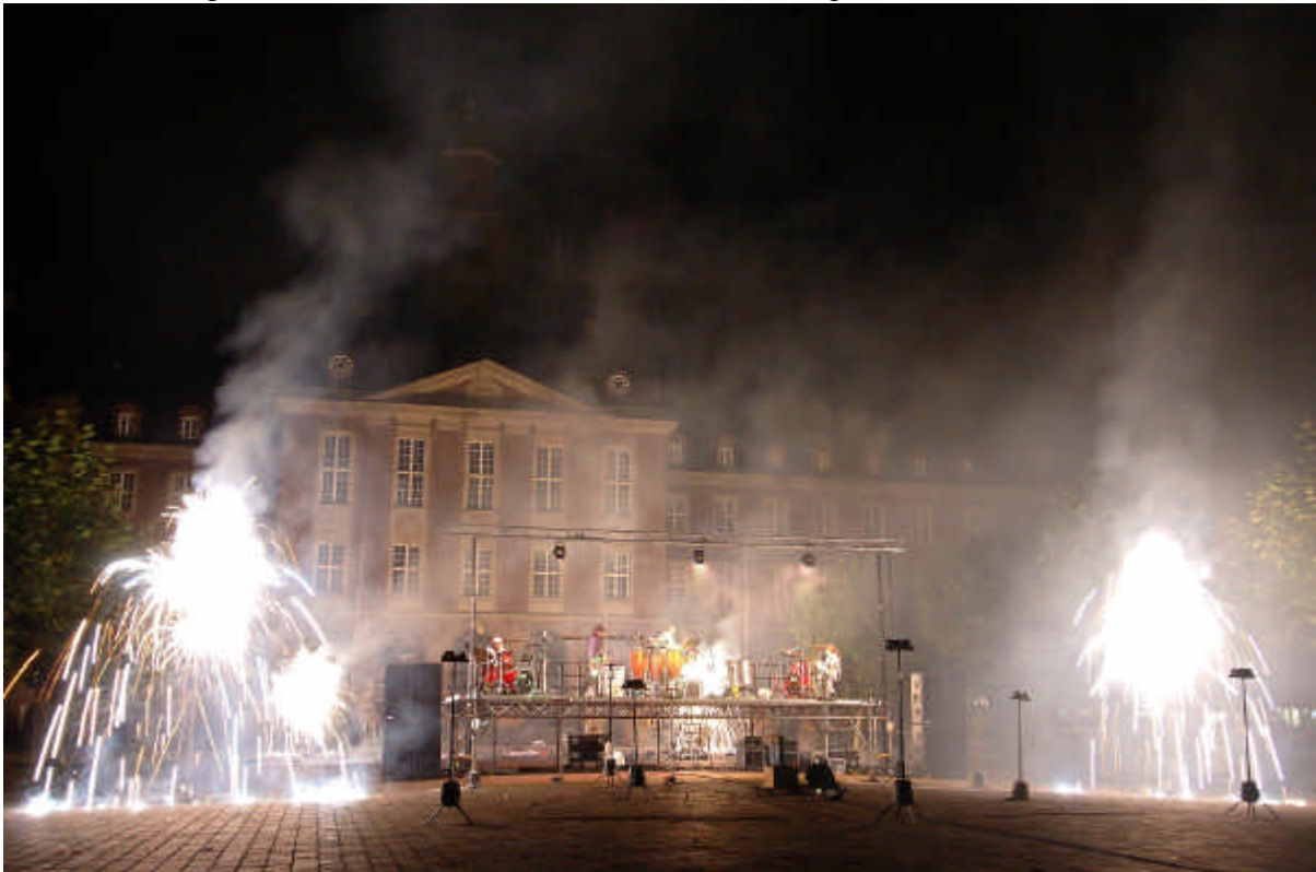
unten – „Lichtgestalten“, Herne 2005 ca. 2.000 Besucher, gleiche Bühne ca. 1,2 Arbeitshöhe,