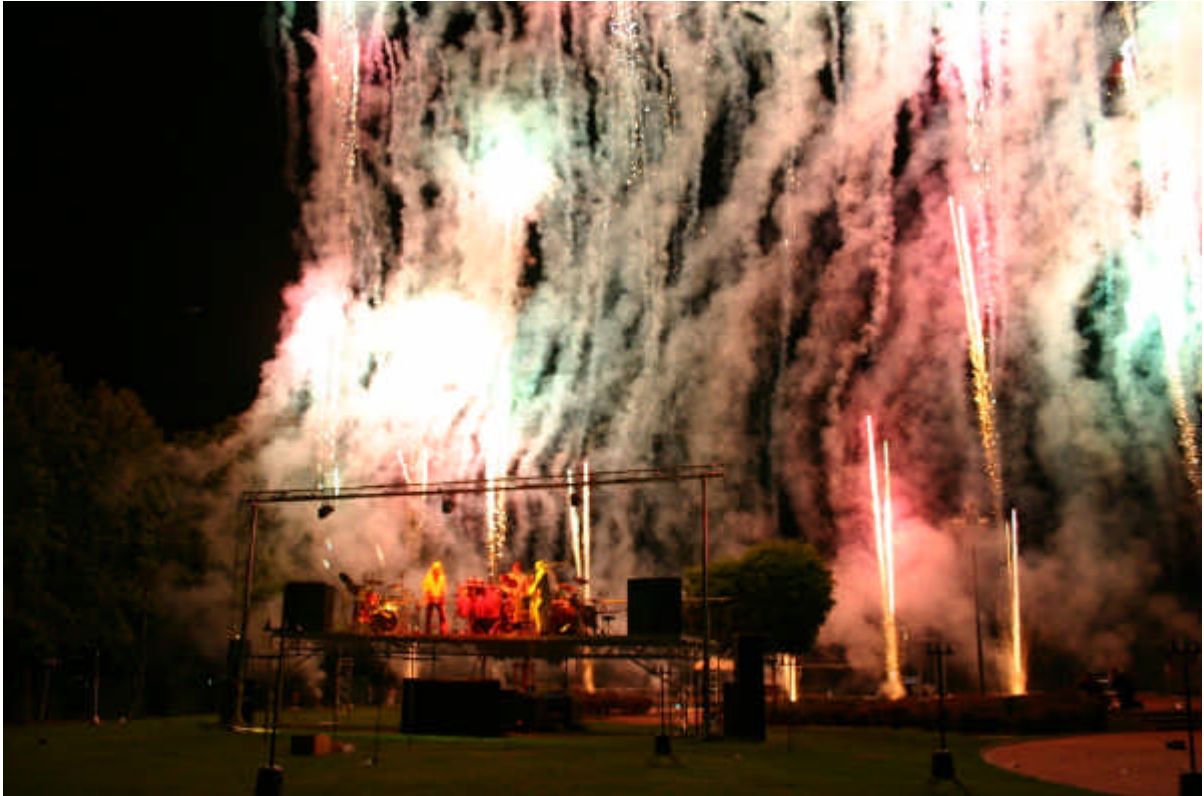
oben – „Seegeflüster“, Hagen 2005 ca. 6.000 Besucher, eigene Bühne ca. 2m Arbeitshöhe, Traverse ca. 6m Höhe, Bühnenbreite 10m, Bühnentiefe 2m, incl. Licht + Ton