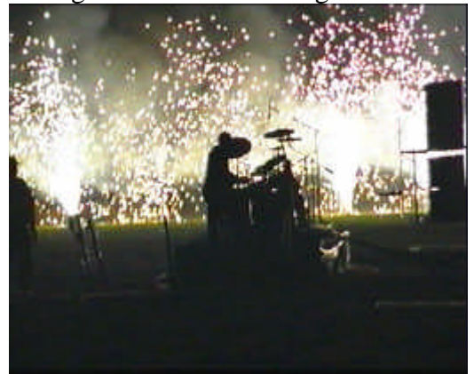
vor 10m hoher Vulkanfront