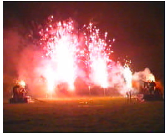
5m hohe Wechselvulkanen