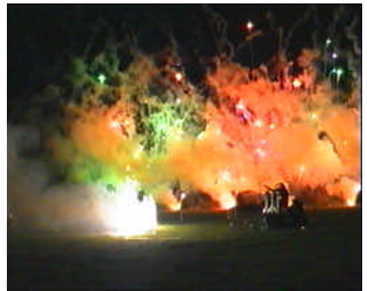
vor gefächerten römischen Lichtern