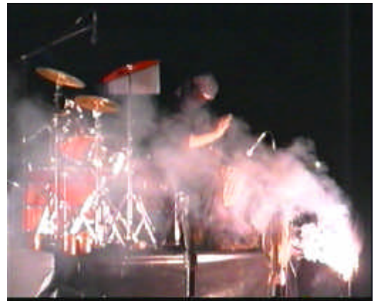
Schlagwerker im Blitzlichtgewitter